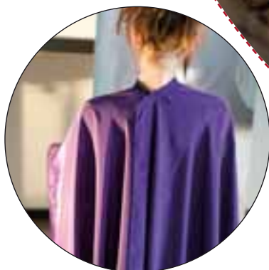
Art. 236 Vestaglia extra