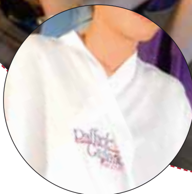
Art. 215 Mantella extra