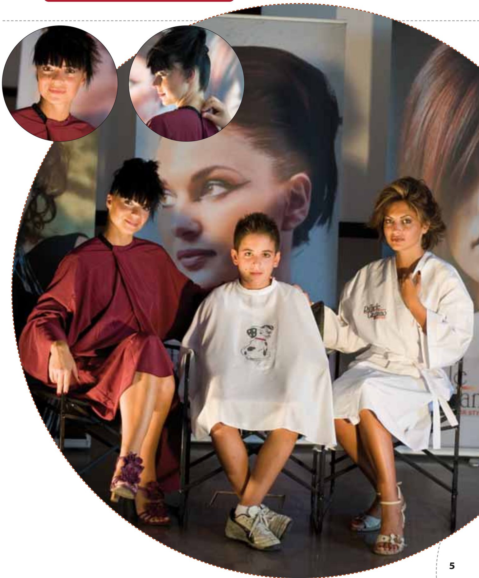
Art. 190 Kimono con maniche