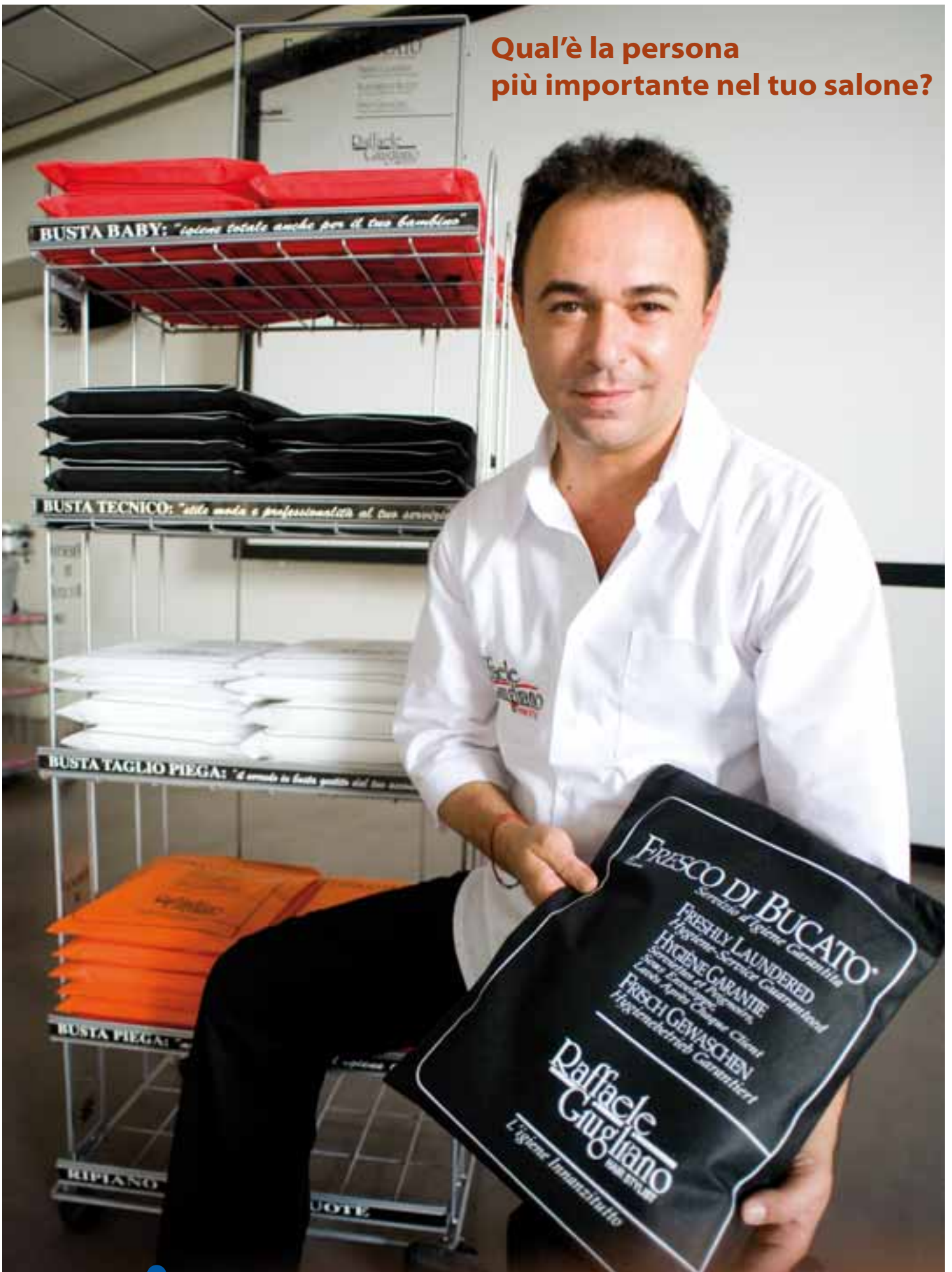
Il parrucchiere indossa CDBCU bianca ricam. R.G. e CDBPU nero

Qual'è la persona più importante nel tuo salone?